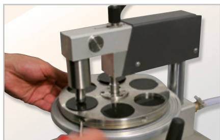
plan und einfach fixieren