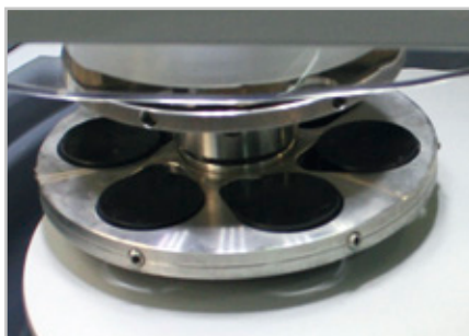
Zentraldruck erfordert nivellierte Proben