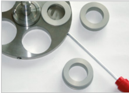
passende Distanzringe einsetzen